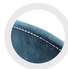
TOP STITCH POINT AVANT

AVAILABLE IN WHITE, BLACK, OR CHARCOAL GREY OFFERTES EN GRIS FUSAIN, NOIR OU BLANC