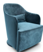
L5705 ARMCHAIR 360° SWIVEL & ROCKER FAUTEUIL BERÇANT ET PIVOTANT À 360° L/W 27" X L/D 33" X H 34½"