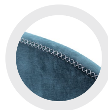
CROSS STITCH POINT DE CROIX