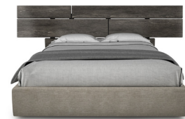
9149-9420U LIT COMPLET QUEEN COMPLETE QUEEN BED 103" X 88 1/2" X 41 1/4"