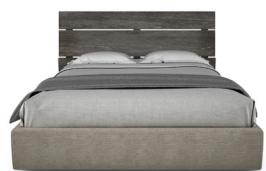
9160-9420U LIT COMPLET QUEEN COMPLETE QUEEN BED 68 1/2" X 88 1/2" X 41 1/4"