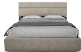
9160U-9420U LIT COMPLET QUEEN COMPLETE QUEEN BED 68 1/2" X 88 1/2" X 41 1/4"