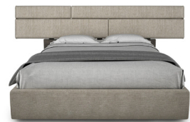
9149U-9420U LIT COMPLET QUEEN COMPLETE QUEEN BED 103" X 88 1/2" X 41 1/4"